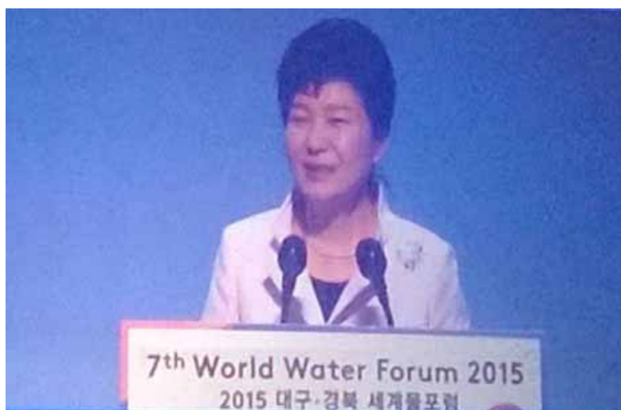
Приветствие участникам форума от Президента Кореи г-жи Пак Кын Хе

Третье , вступить в эру примирения для искоренения конфликтов. Госпожа президент отметила, что в этом году исполняется 70 лет со дня разделения Кореи на Южную и Северную и что, по ее мнению, именно водные вопросы могут и должны смягчить отношения между севером и югом. Зал поддержал Президента аплодисментами.